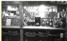
※週末は未就学児のお子様をお断りする場合があります。