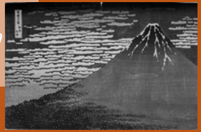
葛飾北斎(富嶽三十六景 凱風快晴) アレン・メモリアル美術館蔵

【会場】 静岡市美術館 【開催期間】 6月8日(土)～7月28日(日) 【斡旋価格】 一般/800円(当日1,200円) 大高生・70歳以上/400円(当日800円)