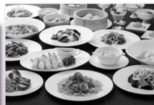
※写真はイメージです。