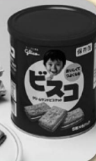
5枚ずつの 分包が6袋入り