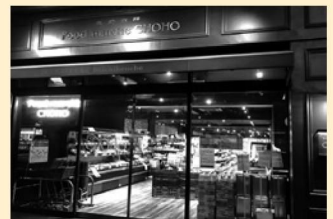
Food marche CHOHO