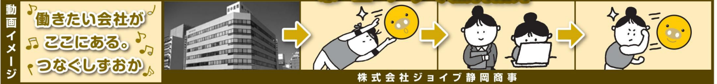
株式会社ジョイブ静岡商事