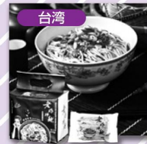
ラオマ・パンメン 汁なし本格担々麺 2,268円