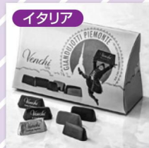
ヴェンキジャンデューヤ ギフトボックス 4,104円