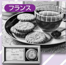
ル・コルドン・ブルーガレット 紅茶セット 3,888円