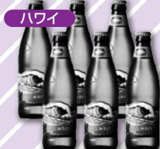
コナビールビッグウェーブ 6本 4,400円