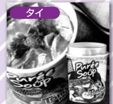
トムヤムカップスープ 2,268円

お問合せ 0120-212-213 携帯からは 03-6739-3264 平日10:00～17:00