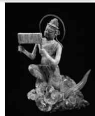
国宝《雲中供養菩薩像 南1号》天喜元(1053)年 平等院蔵【後期展示】