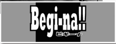
くつろぎスペース

乳児のおむつ交換や授乳もできたり、小さなお子様が遊べたりするコーナーも完備。競輪場を見る目が変わっちゃうかも!?